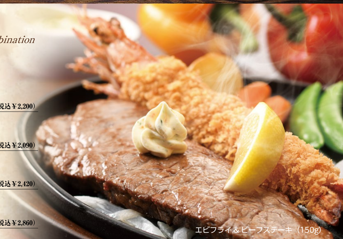
エビフライ&ビーフステーキ (150g)