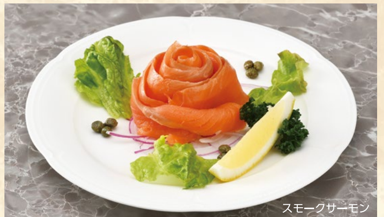
スモークサーモン