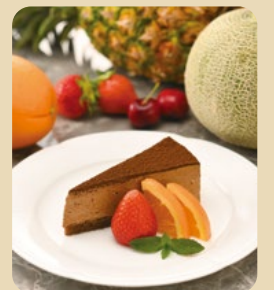
デザートは季節によって替わります。