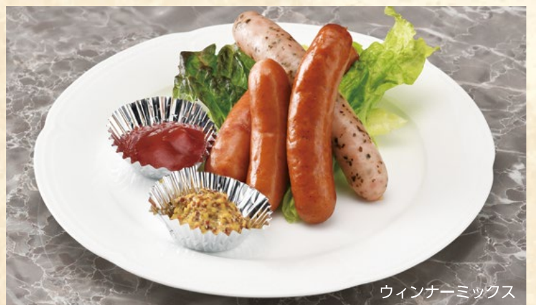
ウインナーミックス