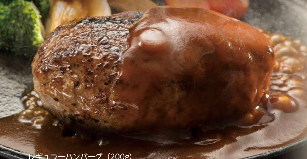
レギュラーハンバーグ (200g)

ハンバーグにはアレルギー物質として ●卵 ●エビ ●くるみが含まれています。食品添加物は一切使用しておりません。