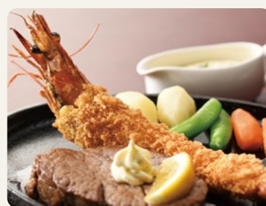
※写真はテンダーロインステーキにトッピングの例