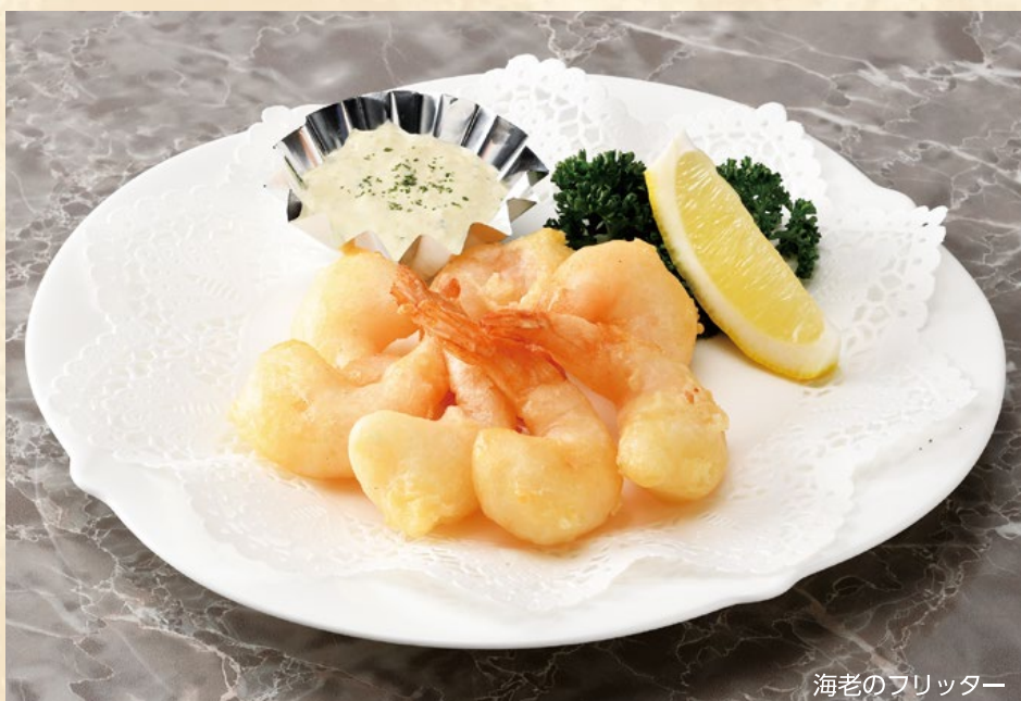
海老のフリッター