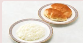
◆ライス or パン