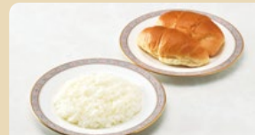
◆ライス or パン